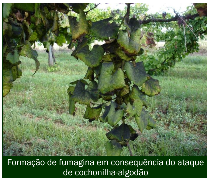
Formação de fumagina em consequência do ataque de cochonilha-algodão

Nas parcelas de Vinha ou mesmo em videiras ou grupos de videiras onde a cochonilha esteja instalada, pode ser feito um tratamento específico, localizado, dirigido apenas a estas videiras e às vizinhas mais próximas.