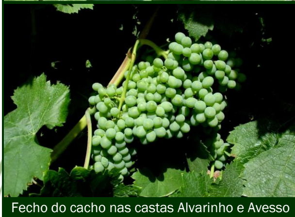
Fecho do cacho nas castas Alvarinho e Avesso