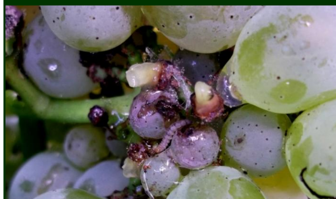
Larva de traça-da-uva e seus estragos