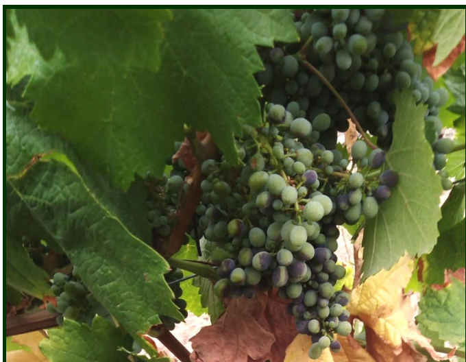
Black-rot nos cachos

A sensibilidade da Vinha ao Black rot está em declínio. No entanto, certas condições meteorológicas, como um episódio de chuva a que se sucedam dias de calor, podem criar condições para contaminações dos bagos até ao início do pintor .