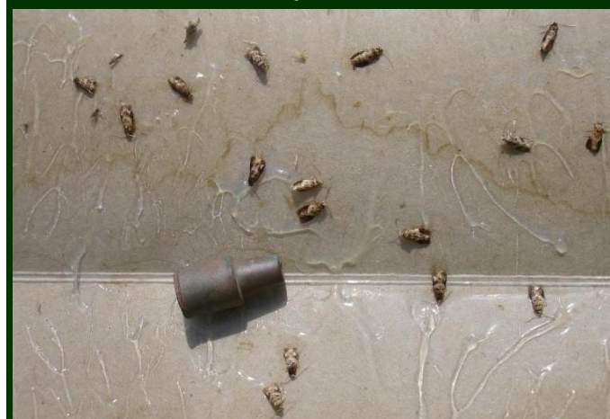
Machos adultos de traça capturados na armadilha com feromona