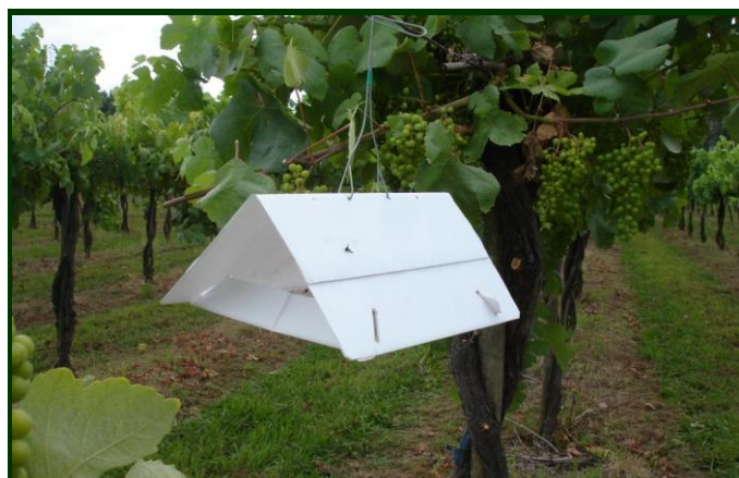
Armadilha tipo "delta" para monitorização dos voos de traça-da-uva

As condições meteorológicas são favoráveis à postura dos ovos, que darão origem às lagartas da 2ª geração. No entanto, as elevadas temperaturas que têm ocorrido também os destroem. Nas observações que realizámos nas últimas semanas na Região, não detetámos a presença desta praga.