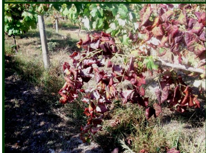
Flavescência dourada em castas branca e tinta

Marque as videiras afetadas para as arrancar depois da vindima ou arranque-as de