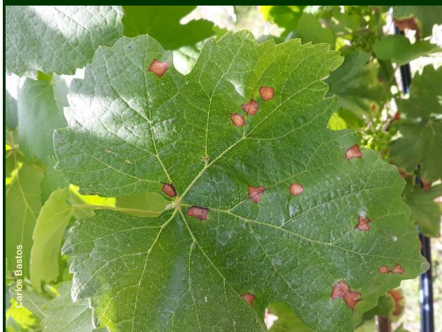
Pústulas na folha