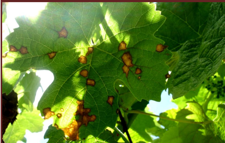
Manchas dispersas na folha (forma de “tiro de chumbo”)