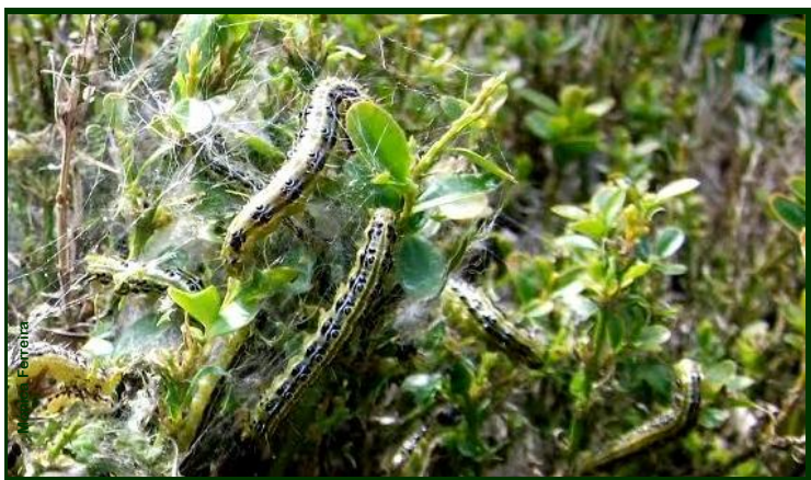
Lagartas de traça do buxo (tamanho próximo do natural)

Se a(s) planta(s) estiver(em) muito danificada(s) e desfolhada(s), aplique um adubo ao solo e regue pelo pé, procurando assim ajudá-la(s) a recuperar.