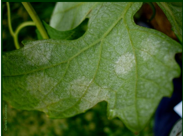
Míldio – esporulação, na face inferior da folha