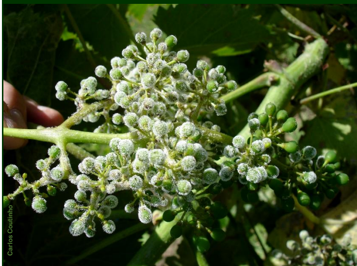
Míldio esporulado, no cacho no estado grão de chumbo