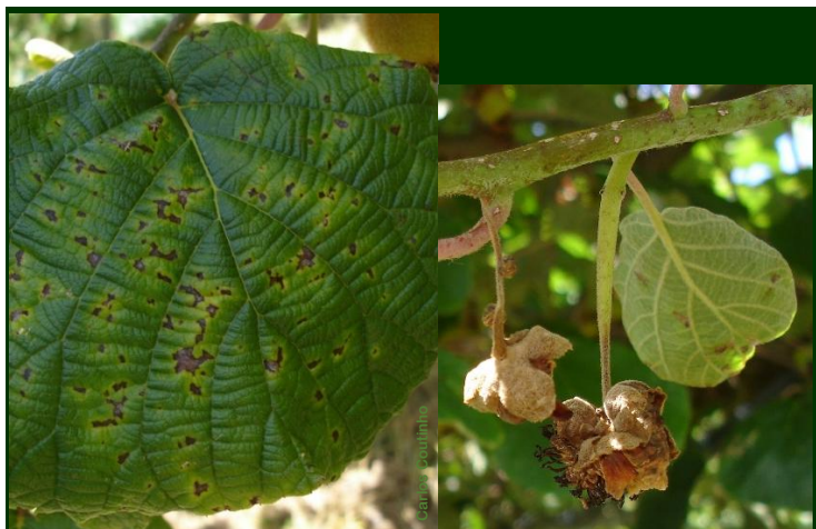
Sintomas de PSA em folha e em frutos jovens

As plantas e os ramos mortos pela PSA devem ser cortados, retirados dos pomares e guardados em local abrigado, para queimar passado o período de proibição de queimas e queimadas.