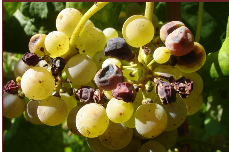
Bagos maduros com manchas de black-rot necrosadas