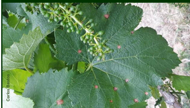
Pústulas nas proximidades de cacho, que será mais facilmente infetado