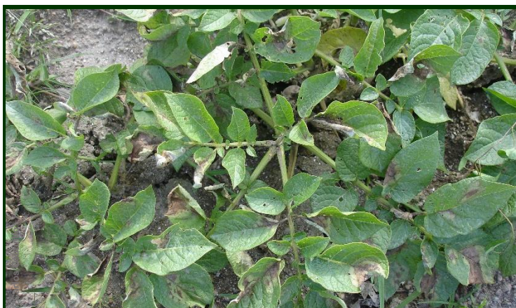
Manchas de míldio nas folhas de batateira

Consulte a Ficha Técnica nº 75 (I Série/ DRAEDM)