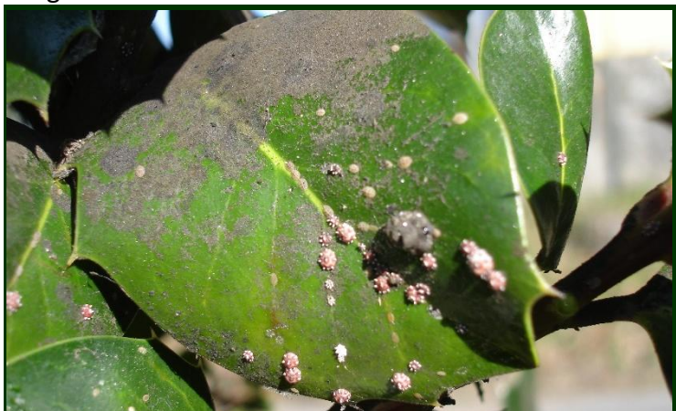
Cochonilha cerosa nas folhas de azevinho com a consequente fumagina

Repetir o tratamento passadas três semanas. Se a fumagina persistir por muito tempo, pode aplicar um fungicida à base de cobre, para ajudar a destruir o fungo.