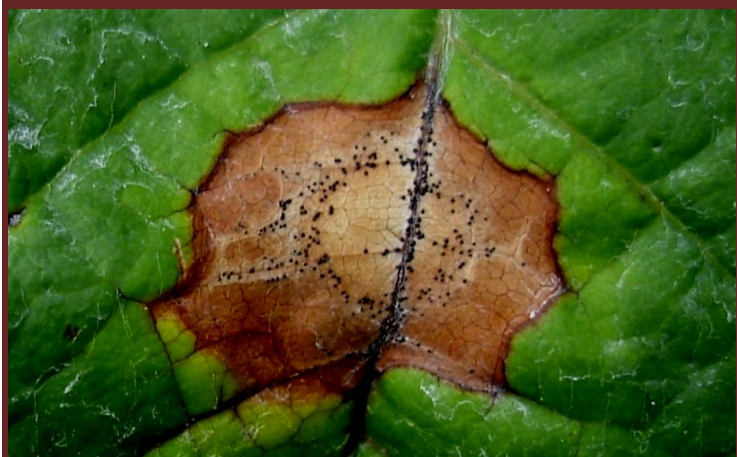
Mancha necrosada, com picnídeos (imagem muito ampliada)