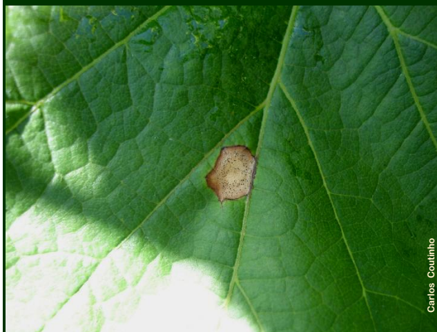
Pústula com picídeos formados