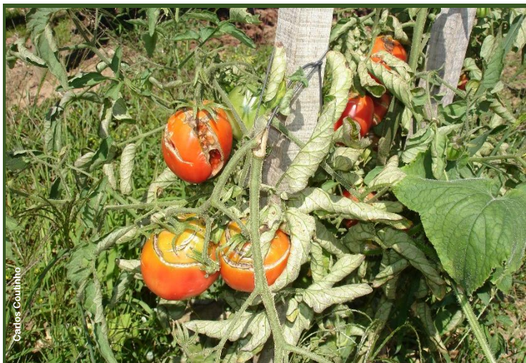
Stress hídrico em tomateiro: tomates fendidos