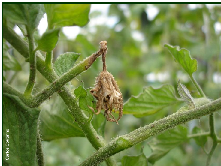
Flor de tomateiro destruída pelo míldio ↑ Tomates com sintomas de forte ataque de míldio ↓

Se necessário, aplique um inseticida homologado .