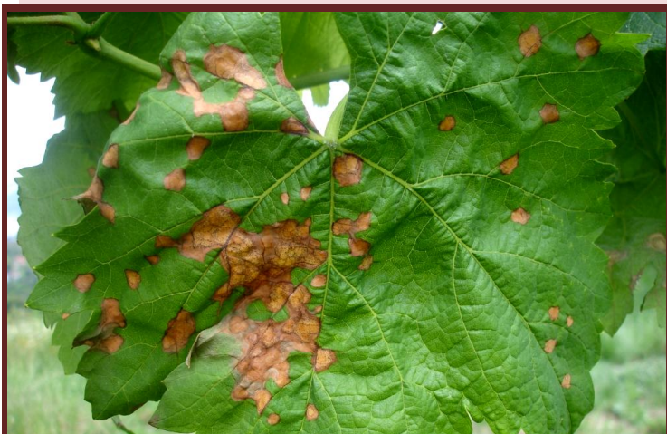
Manchas (pústulas) agrupadas na folha

É uma doença da Vinha originária da América do Norte. Na Europa, foi detetada pela primeira vez em 1885, em França. O fungo afeta apenas os órgãos verdes da videira, mas as necroses provocadas persistem nas varas atempadas. No Entre Douro e Minho, é observada desde 2000, ano em que foi identificada em amostras provenientes de Ponte de Lima. Daí para cá tem-se generalizado a sua presença por toda a região. Em 2018, registaram-se ataques graves e pela primeira vez, perdas acentuadas de produção.