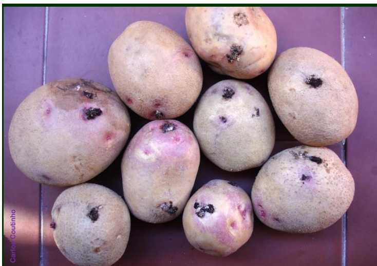
Sintomas externos de traça-da-batateira (saída de excremento das larvas no topo da galeria escavada na polpa da batata).