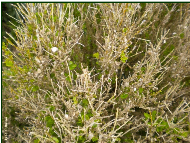
Planta muito danificada pelo míldio do buxo

Recomenda-se, durante o verão: ► regar pelo pé, sem molhar a folhagem ► remover as folhas caídas e a parte superficial do solo na proximidade de plantas doentes ► arrancar e queimar as plantas mortas ► cortar e queimar os ramos doentes ► desinfetar com lixívia os instrumentos de corte utilizados ► aplicar um adubo ao solo e regar pelo pé, procurando ajudar a planta a recuperar, emitindo novas folhas.