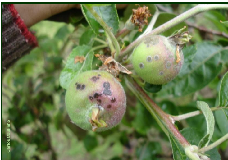
Pedrado em maçãs em início de desenvolvimento

Para combate ao pedrado no Modo de Produção Biológico , são autorizados fungicidas à base de enxofre ou de Bacillus subtilis (SERENADE MAX).