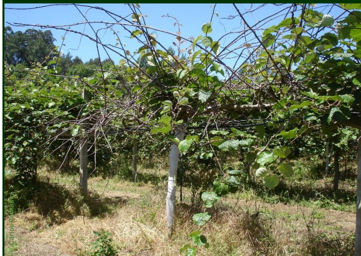
Planta com PSA, em declínio (varas secas)

Para facilitar a circulação do ar e a entrada da luz, contrariando o desenvolvimento e expansão da bactéria causadora da doença, devem ser feitas podas em verde e cortar as ervas adventícias e dos enrelvamentos .