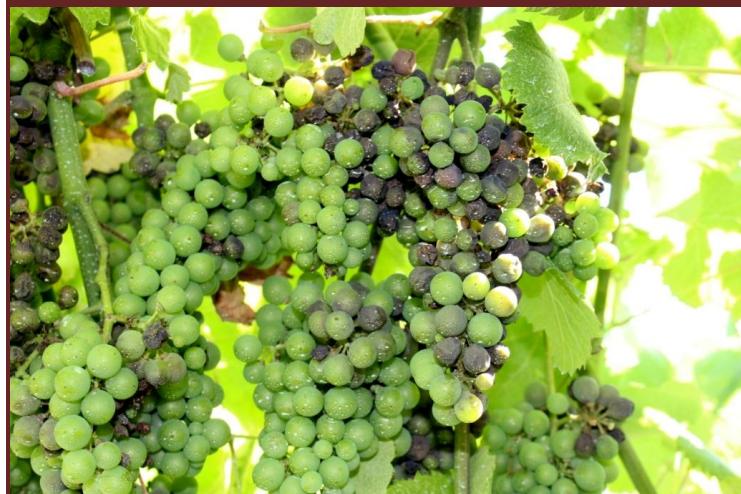
Forte ataque aos bagos ainda verdes (fecho do cacho)