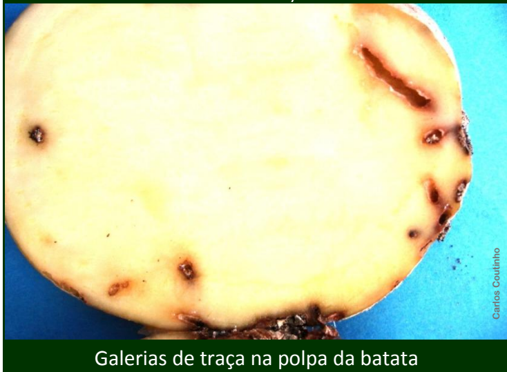
Galerias de traça na polpa da batata

Devem também ser tomadas algumas medidas preventivas .